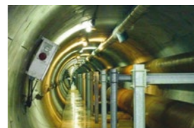
CPCU, Récupération et condensation des buées pour valorisation et fiabilisation de la centrale de Bercy (450 MWth), 2011