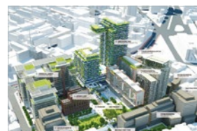
Paris Habitat, Diagnostic réseaux fluides, 2011