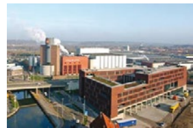
INBEV (Belgique), Assistance technique à l'amélioration de la productivité, 2011